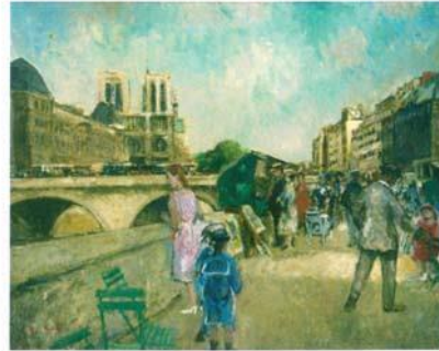
FRANÇOIS GALL, EUGÉNIE GALL, SES ENFANTS ET LES BOUQUINISTES, QUAI DES GRANDS-AUGUSTINS, PEINTURE. © COMITÉ FRANÇOIS GALL