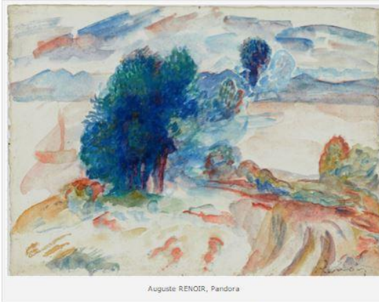
Auguste RENOIR, Pandora

Warhol, Renoir, Banksy. Mirò, Carrà, Picasso, Klee, Raffaello. Solo alcuni nomi per rendere l'idea del livello delle opere che si potranno ammirare dal 14 al 17 settembre al Centro Esposizioni Lugano nella seconda edizione di WOPART , la più importante fiera svizzera interamente dedicata alle opere d'arte su carta.