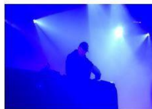
Sonic Somatic, un'idea di opera d'arte smaterializzata.