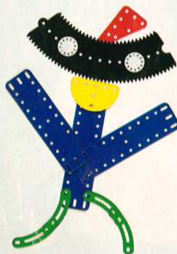
Metalmeccanici, Enrico Baj