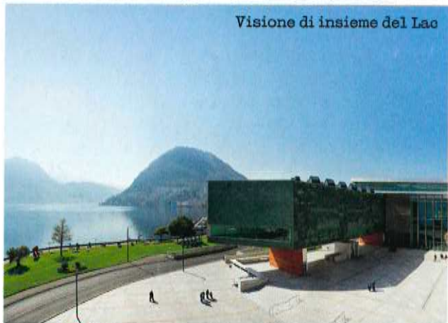
Visione di insieme del Lac