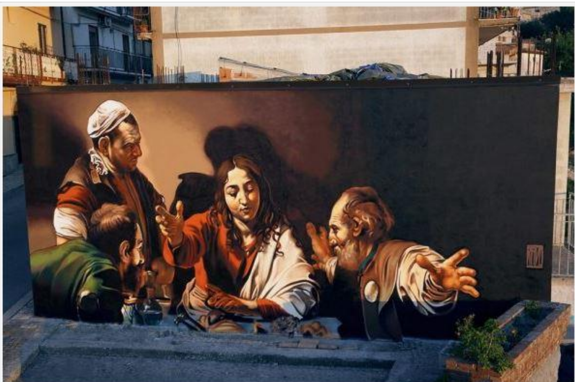
Andrea Ravo Mattoni, Cena in Emmaus. Sprayed wall, San Salvatore di Fitalia, July 2016