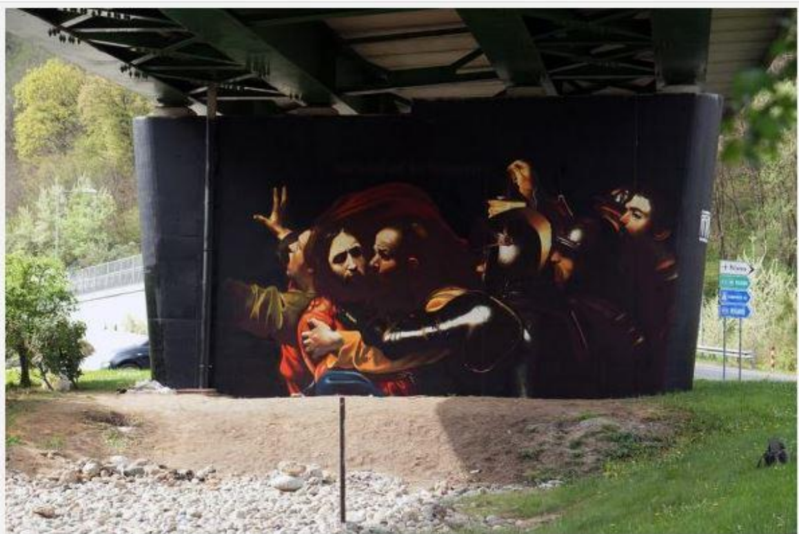
Andrea Ravo Mattoni, La cattura di Cristo Sprayed wall, Varese, April 2016

In contemporanea con la mostra " Street Art Ways ", negli spazi espositivi di Artrust sarà possibile visitare anche la Capsule Exhibition dedicata a Victor Vasarely , secondo appuntamento della serie 51 steps . Gli spettatori dovranno salire 51 gradini nel corso della visita alla mostra che condenserà, in un inedito percorso ascendente, una selezione di opere dell'artista ungherese, naturalizzato francese, fondatore della Op Art.