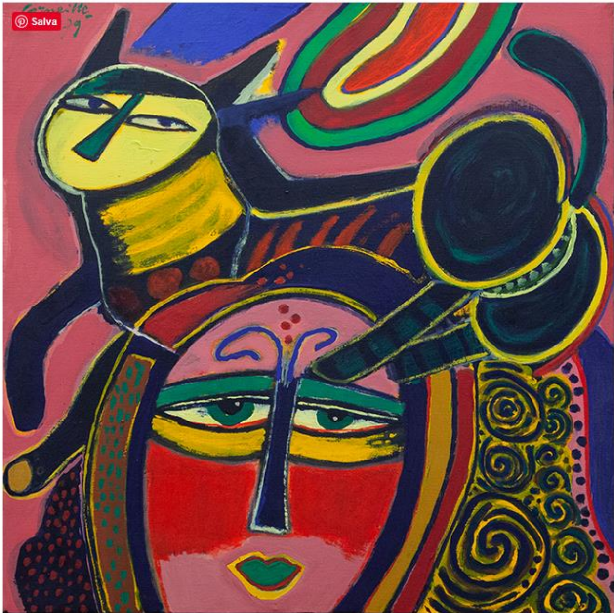
Corneille – Visage de chat, visage de femme, 1979. Acrilico su tela