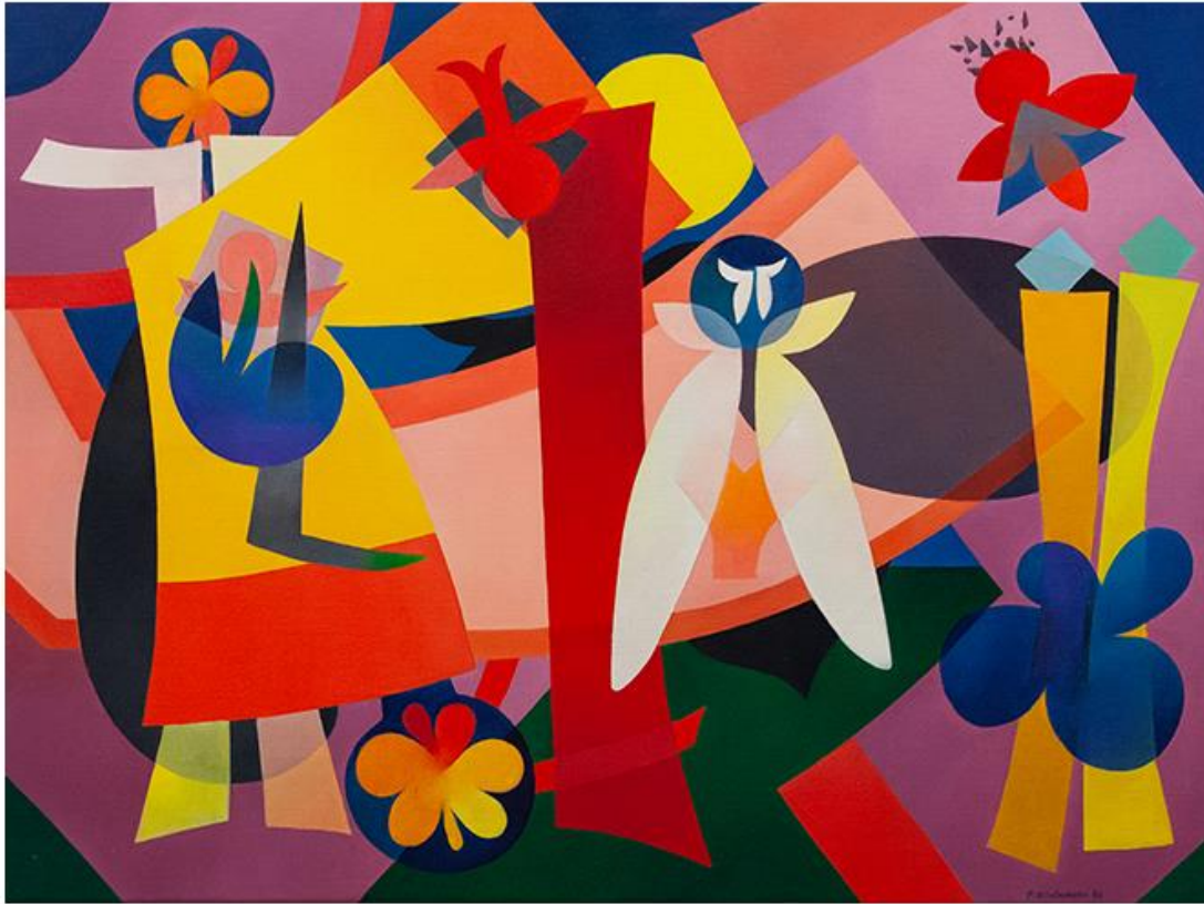
Peter Wiederkehr - Fröhliches Gute, 1986 . Acrilico su tela