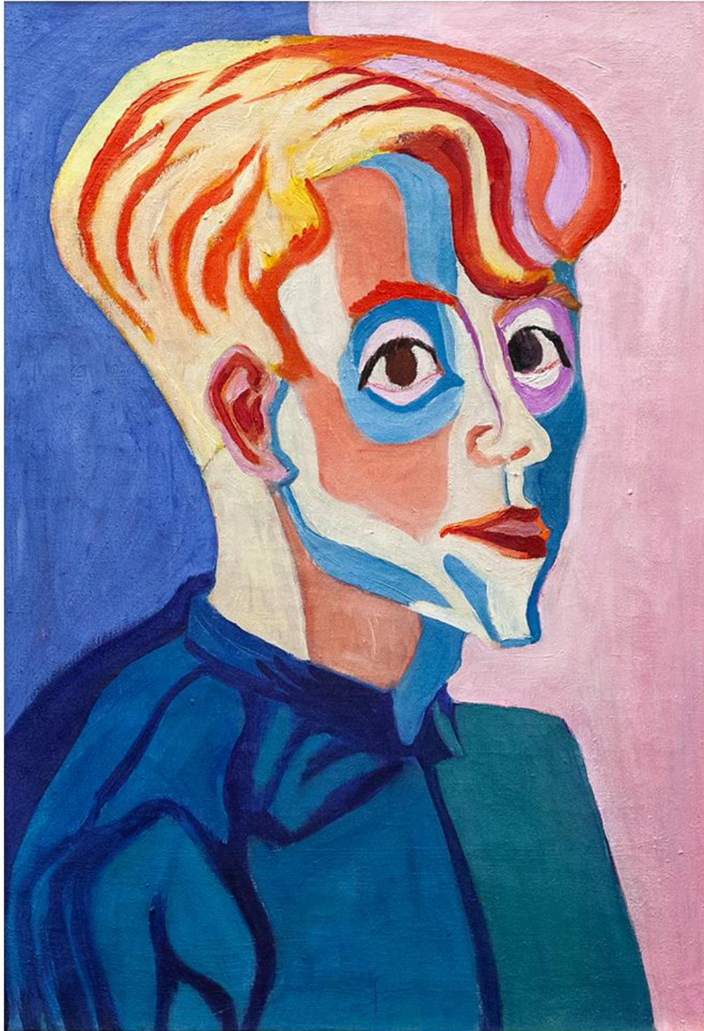
Paul Camenisch – Ritratto di Max Hauffer, 1927 . Olio su tela

In dialogo tra loro artisti di movimenti, stili, epoche distanti e differenti: si va da Castelli a Le Corbusier e Léger , dagli esponenti del gruppo CoBrA a quelli del gruppo Rot Blau , dai Nouveau Réalistes Tinguely , Spoerri e Niki De Saint Phalle, al re della Pop Art Andy Warhol , per arrivare fino alla Street Art con le opere di Banksy .