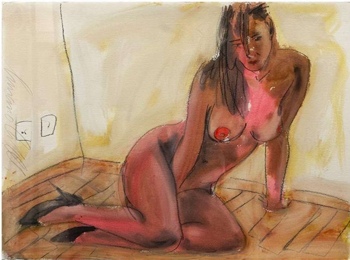
Luciano Castelli - Nudo femminile seduto, 2000 , Gouache, acquerello e cartoncino su carta.