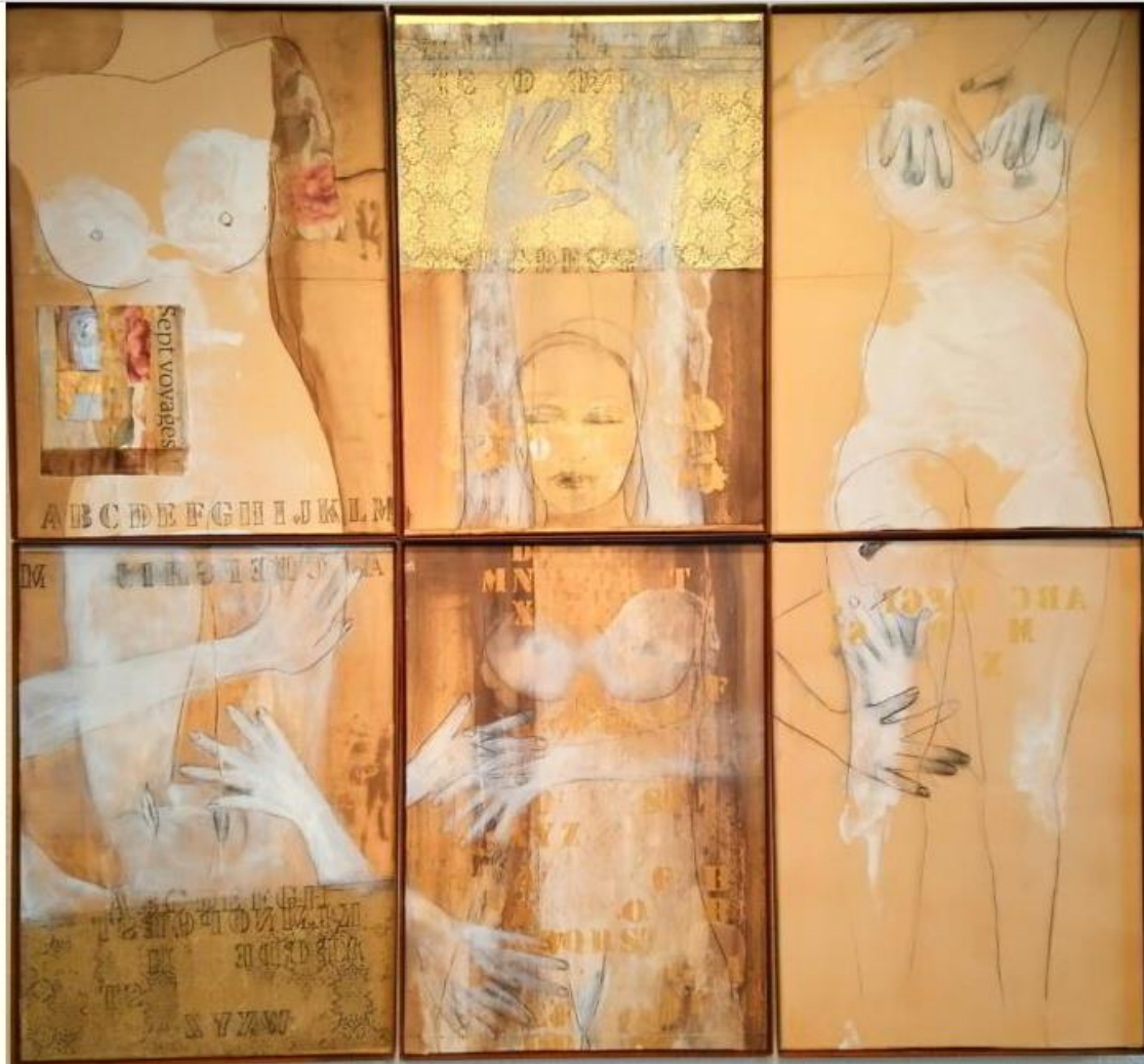
Nella foto: Cassandra WAINHOUSE, 7 Voyages 2019 – papier 100×140