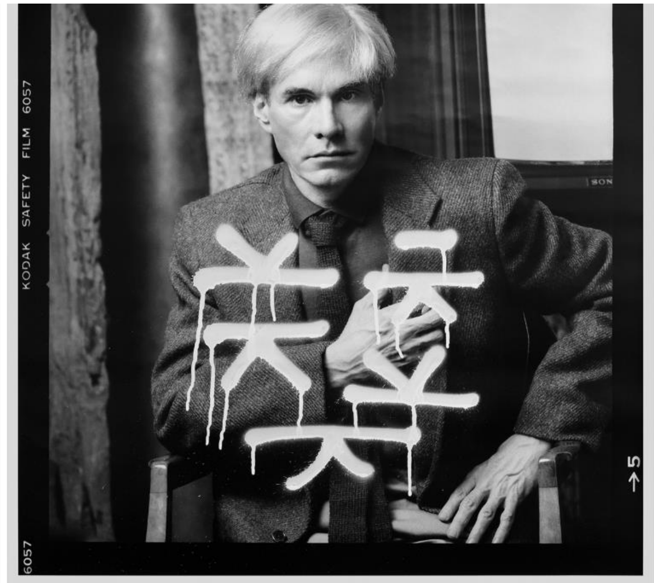
Raul, Meditations with Andy, M White 10/10 , 2019. White spray paint on Fujifilm paper RA4 process, 70 x 70 cm

All'origine della carta: cinque papiri dal Museo Egizio di Firenze è la mostra organizzata da Giorgio Piccaia e Maria Cristina Guidotti con il supporto di Corrado Basile, insieme alla Direzione Culturale di WopArt e con la collaborazione del Comune di Lugano, che affronterà il tema della storia della carta e della scrittura, esponendo per la prima volta a Lugano cinque papiri affidati in prestito dal Museo Egizio di Firenze.