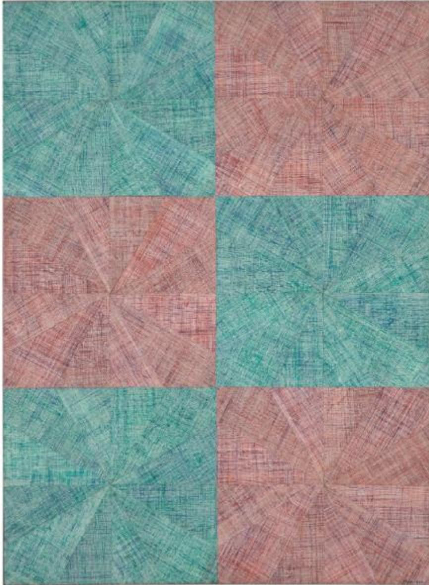
Mario Nigro, Spazio-vibrazione simmetrica alternata con urto (1964). Tempera collage su tela 73x55 cm.

L'Area Talk sarà inoltre a disposizione dei professionisti coinvolti nella realizzazione della fiera che potranno concordare insieme ai curatori un momento a loro dedicato per la programmazione di conversazioni specifiche sul mondo dei work on paper .