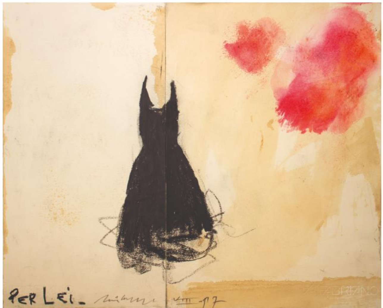
Piero Pizzi Cannella, Per lei (2017). Carboncino acquarello e matita su carta, 43,5x35,5 cm.

E ancora, all'interno dell'esclusiva Vip Lounge realizzata per il secondo anno in collaborazione con la Maison Suisse d'Horlogerie Eberhard & Co. affiancata dalla prestigiosa Orologeria Mersmann , verranno esposte cinque sculture della serie Gli Orologi Molli di Salvador Dalí grazie a Dalí Universe , società specializzata nella custodia e valorizzazione del lavoro dell'artista e che gestisce una delle più grandi collezioni private al mondo di opere d'arte di Dalí.