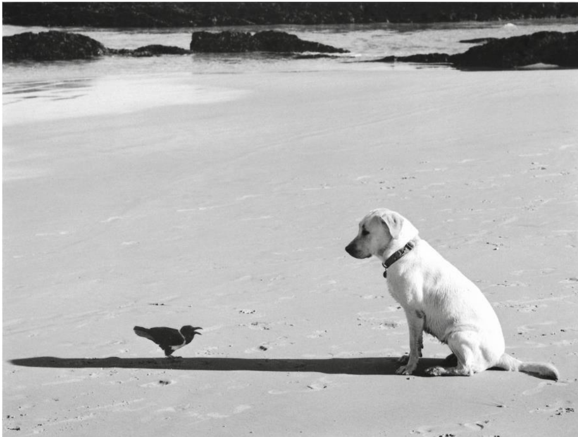
Peritti Sammallahti. Western Cape, South Africa, 2002. Stampa alla gelatina ai sali d'argento.

Quest'anno la fiera si arricchisce inoltre di una nuova area di 1000 mq denominata la Piazza della Cultura : un intero padiglione dedicato all' entertainment del pubblico attraverso spazi adibiti a esposizioni , incontri e dibattiti culturali , laboratori per i più piccoli, ristoranti e aree relax.