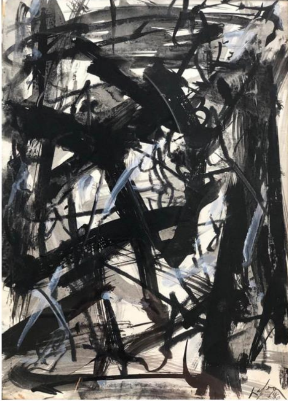
Emilio Vedova. Immagine del tempo, 1960. Olio e tecnica mista su carta, cm 32,5x23,1.

Tra le novità di quest'anno, la collaborazione tecnico-organizzativa con il gruppo BolognaFiere Spa, primo in Italia per fatturato realizzato all'estero con oltre 80 manifestazioni in tutto il mondo, e il determinante apporto di Alberto Rusconi, imprenditore e collezionista di fama internazionale che ha deciso di investire nel progetto di WopArt.