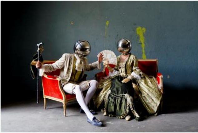
The strangers, 2019. Stampa fine art glacier su carta. Alford Galerie_50x70cm.

La sezione Emergen amplierà la proposta espositiva portando in fiera gallerie giovanissime con progetti e artisti internazionali . Luca Zuccala curerà Dialogues , proponendo una lettura dell'eterogenea e dinamica natura del mezzo cartaceo attraverso i progetti selezionati dai curatori e dalle gallerie partecipanti.