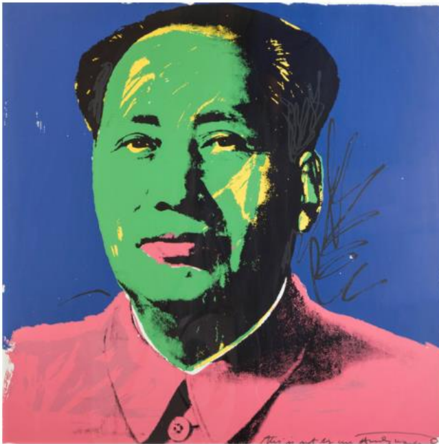
Andy Warhol. Mao Tse Tung, 1986. Serigrafia su carta con dedica e firma in originale sul fronte.