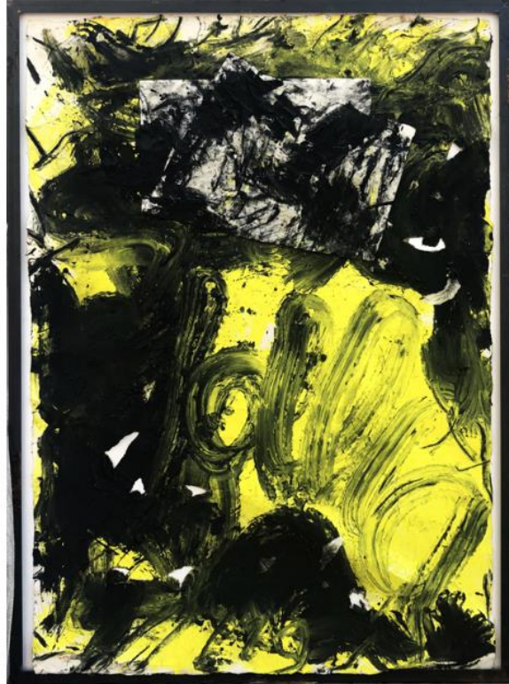
Giuseppe Spagnulo. Senza Titolo. Tecnica mista, 230x160_2008.

Dopo il successo delle prime tre edizioni, il format della fiera si rinnova e arricchisce, presentando quest'anno una proposta artistica suddivisa in quattro sezioni . La sezione Main Course , a cura di Paolo Manazza e Mimmo di Marzio, presenterà 43 gallerie suddivise a loro volta in tre filoni, Modern, Contemporary e Old Masters, con lavori che spazieranno dai più celebri maestri del passato agli artisti dei giorni nostri .