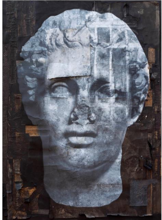
Luca Pignatelli. Eroe, 2013. Tecnica mista su carta, cm 204x151.

Ulteriore novità di questa edizione è la possibilità per tutti gli espositori di presentare nel proprio stand fino a tre opere su supporto non cartaceo , con l'invito a privilegiare dipinti , oggetti o sculture esposti insieme al bozzetto preparatorio su carta : un altro modo per valorizzare i work on paper , riconoscendone il ruolo di interpreti dello spirito poetico e germinale del linguaggio degli artisti .