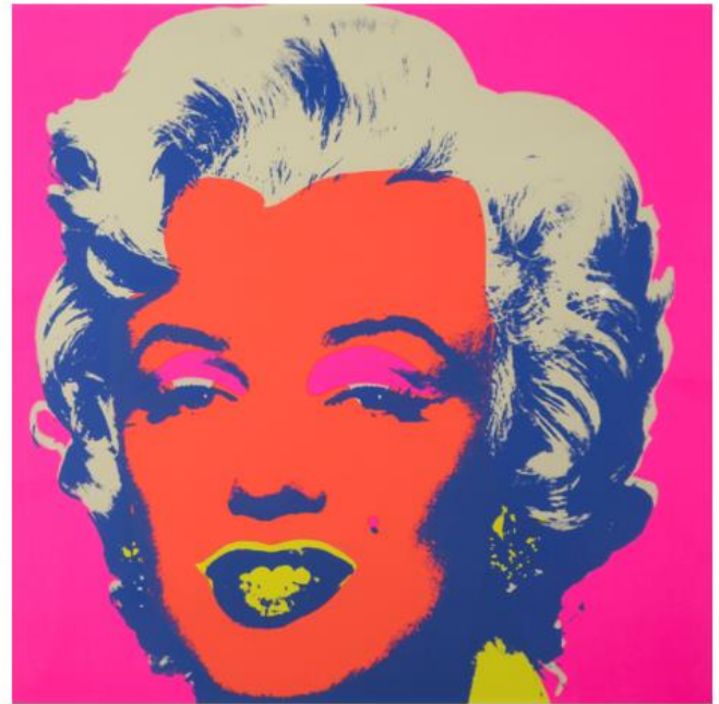
Andy Warhol. Marilyn, This Is Not By Me, 1970. 84,5X84,5. Serigrafia su carta con dedica e firma in originale sul retro.

Per la quarta edizione, che si svilupperà per la prima volta su 7000 mq – l'intera superficie espositiva dei padiglioni fieristici – le gallerie selezionate da un comitato scientifico presieduto da Paolo Manazza, pittore e giornalista specializzato in economia dell'arte, e da Mimmo Di Marzio, giornalista, critico e curatore d'arte contemporanea, presenteranno un ampio panorama di opere realizzate su supporto cartaceo , che spaziano tra stili, linguaggi ed epoche differenti, garantendo una proposta varia e trasversale.