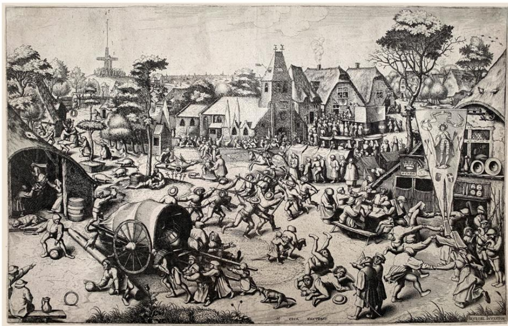
Peter Bruegel. Fiera di San Giorio_1559-62; bulino originale_nmm 332 x 522_rif.7225.

Dopo il successo delle prime tre edizioni, il format della fiera si rinnova e arricchisce, presentando quest'anno una proposta artistica suddivisa in quattro sezioni . La sezione Main Course , a cura di Paolo Manazza e Mimmo di Marzio, presenterà 43 gallerie suddivise a loro volta in tre filoni, Modern, Contemporary e Old Masters, con lavori che spazieranno dai più celebri maestri del passato agli artisti dei giorni nostri .