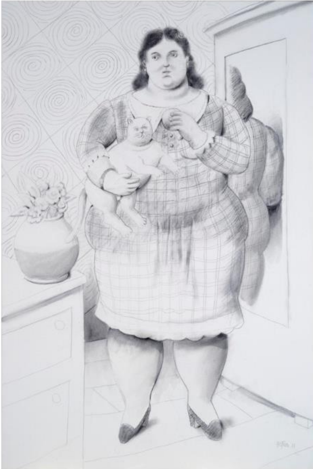
Fernando Botero. Woman with cat 2011. Carboncino su tela 132 x 89 cm. Courtesy: Vitart.

Le attualissime tematiche attivate dai project space saranno approfondite attraverso un ricco public program volto a coinvolgere il pubblico, mettendolo in dialogo con importanti operatori di settore legati a queste realtà. Le opere dell'International Laser Print Show saranno cedute a una cifra simbolica e il ricavato andrà in beneficenza all'Ospedale Pediatrico Bambino Gesù per il progetto "Istituto dei Tumori e dei Trapianti".